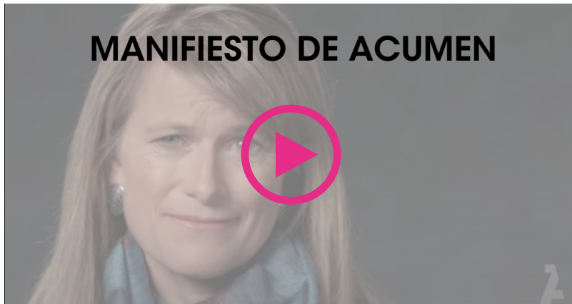
*video en inglés

Acumen es una organización internacional con sede en Estados Unidos dedicada a la Inversión de Impacto. Su filosofía se basa sobre el Capital Paciente, la visión de Acumen es que ni los mercados ni la ayuda por sí solos pueden resolver los problemas de la pobreza. Actualmente más de dos mil millones de personas en todo el mundo carecen de acceso a bienes y servicios básicos, desde agua potable y electricidad hasta educación y libertad para participar en la economía. Nuestra visión es un mundo basado en la dignidad, donde todo ser humano tenga la misma oportunidad.